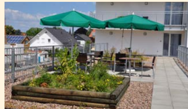
Die Dachterasse kann von allen Wohnbereichen genutzt werden.

Unseren Bewohnern wird eine individuelle Alltagsgestaltung ermöglicht. Wir versuchen strukturbedingte Einschränkungen abzubauen und zu minimieren. Beschäftigungsangebote im Young Care-Bereich richten sich nach den Interessen und Fähigkeiten der Bewohner. Diese sollen ihren Alltag und auch die Beschäftigungsmaßnahmen möglichst selbständig gestalten und durchführen.