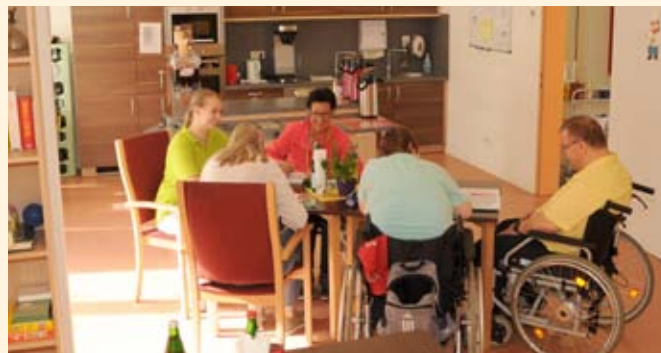
Die Wohnküche ist der zentrale Lebensmittelpunkt im Young Care-Bereich.

Die Beziehung zwischen den jungen Bewohnern untereinander und den Betreuungspersonen basiert auf einer partnerschaftlichen Ebene. Es ist uns wichtig einen familiären Rahmen in einem gemeinschaftlichen Wohngefühl zu bilden. Das tägliche Leben wird in daher in einer Wohngruppe geführt.